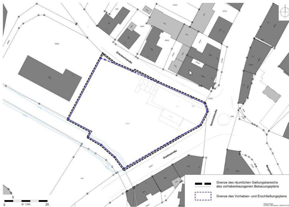
Abbildung 1: Grenze des räumlichen Geltungsbereichs des vorhabenbezogenen Bebauungsplans (schwarz); Grenze des Vorhaben- und Erschließungsplans (blau), ARP Stuttgart, 03.02.2026.

Maßgebend sind die Geltungsbereiche des vorhabenbezogenen Bebauungsplans vom 03.02.2026 sowie des Vorhaben- und Erschließungsplans vom 03.02.2026.